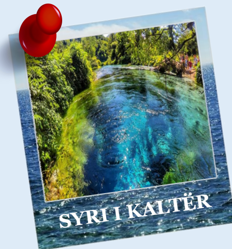
SYRI I KALTËR

Kalaja e Lëkurësit është një ndërtesë e shekullit të XVI. Kalaja ndodhet mes rrënojave të fshatit Lëkurës në majën e një kodre të lartë që ngrihet mbi qytetin e Sarandës. Ka një pozicion të veçantë strategjik nga ku mund të shihni të gjithë qytetin e Sarandës dhe rrugën që shkon në Butrint, gjithashtu mund të shijoni një panoramë të ishujve të Ksamilit. Është kthyer në një nga pikat turistike më të bukura dhe një nga më të frekuentuarat për çdo turist që viziton Sarandën.