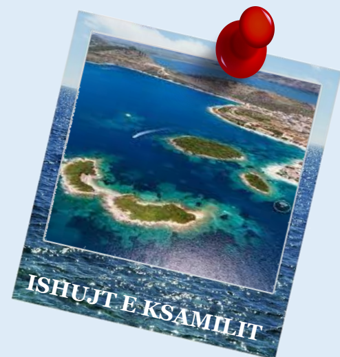
ISHUJT E KSAMILIT

Në brigjet e Jonit në Ksamil ndodhen Ishujt e Ksamilit, të cilët ju vendosin përballë një pamje mahnitëse të detit blu dhe ishujve të vegjël shkëmborë me bimësi të dendur e të egër. Janë ishujt e tij që e bëjnë Ksamilin kaq të veçantë, të dëshirueshëm dhe një zonë unike dhe shumë përfaqësuese të bregdetit shkëmbor shqiptar të Jonit.