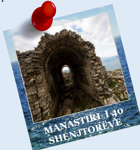
MANASTIRI I 40 SHENJTORËVE

Në brigjet e Jonit në Ksamil ndodhen Ishujt e Ksamilit, të cilët ju vendosin përballë një pamje mahnitëse të detit blu dhe ishujve të vegjël shkëmborë me bimësi të dendur e të egër. Janë ishujt e tij që e bëjnë Ksamilin kaq të veçantë, të dëshirueshëm dhe një zonë unike dhe shumë përfaqësuese të bregdetit shkëmbor shqiptar të Jonit.