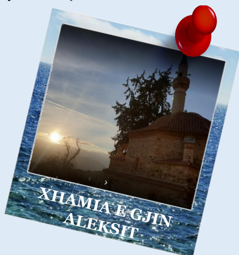
XHAMIA E GJIN ALEKSIT

Manastiri i 40 Shenjtorëve ndodhet në lindje të Sarandës. Ai gjendet në vendin nga ku shihet e gjithë Saranda. Është ndërtuar në shekullin XV. Një mundësi më shumë për t'u zhytur në një atmosferë mistike.